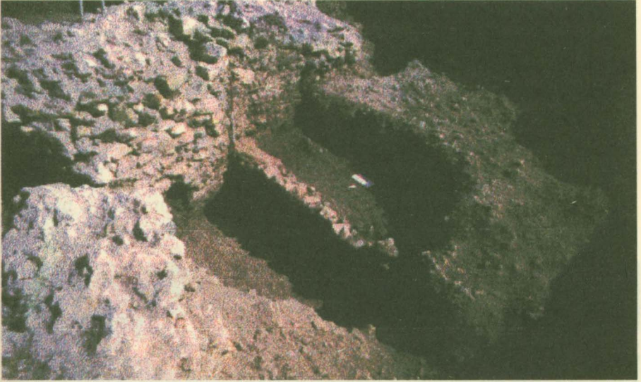
12. yüzyılda Dorylaion Kalesi'nden görünüş

için de imparator Manuel 1175 yılında bölgeye yeni bir sefer düzenledi ve Dorylaion'u bir sınır kalesi olarak yeniden inşa etmeye gayret gösterdi 36 . Zamanın yazarları tarafından övgüyle bahsedilen bu inşaat sırasında Manuel'in de bizzat çalıştığı kaydedilmiştir. Bunun sonucunda Sel-